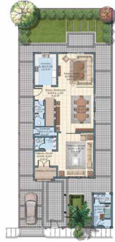
مخطط الدور الأرضي