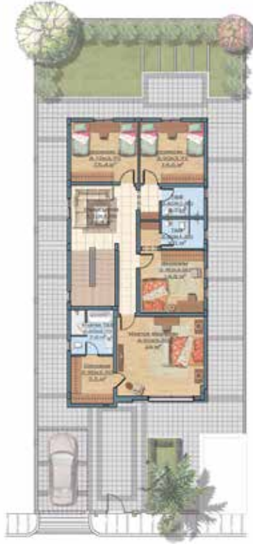
مخطط الدور الأول