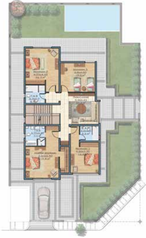
مخطط الدور الأول