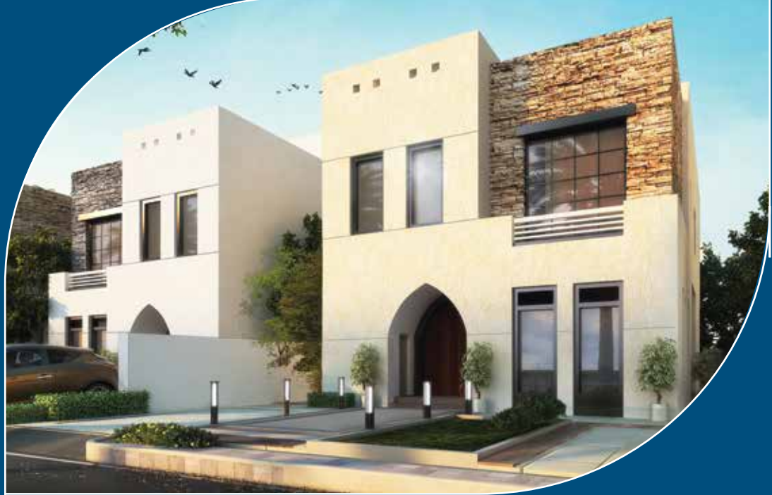
النموذج العربي Arabic villa