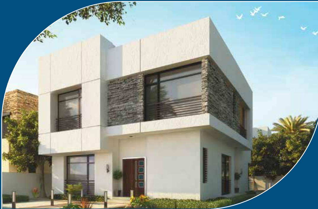
نموذج الزاوية Corner Villa