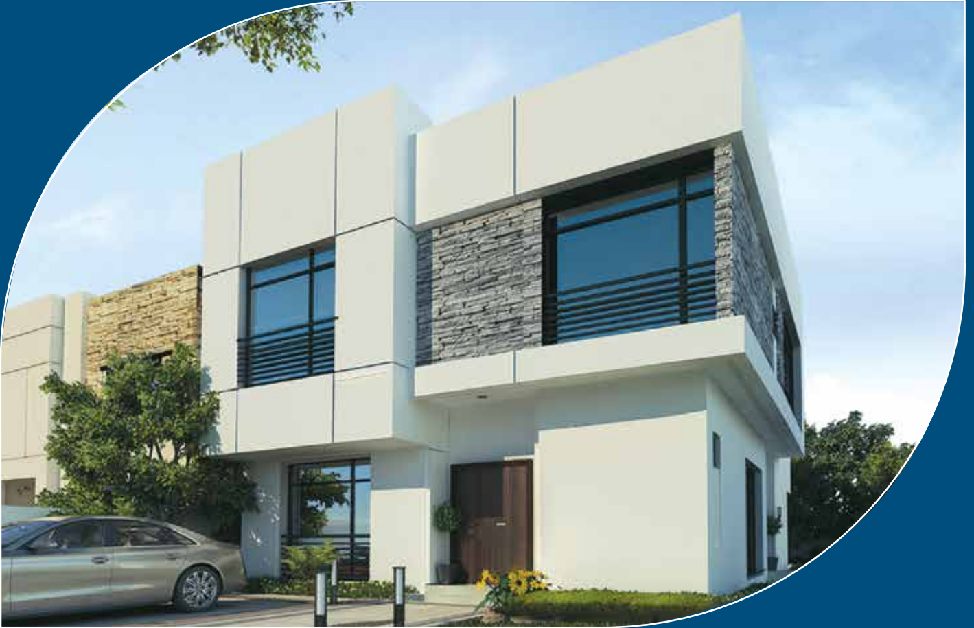
نموذج الزاوية Corner Villa