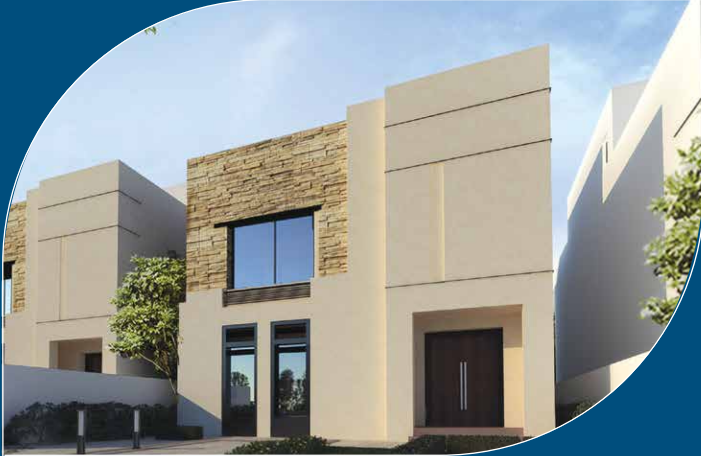
النموذج العصري Modern Villa