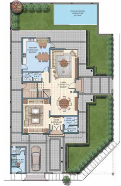
مخطط الدور الأرضي