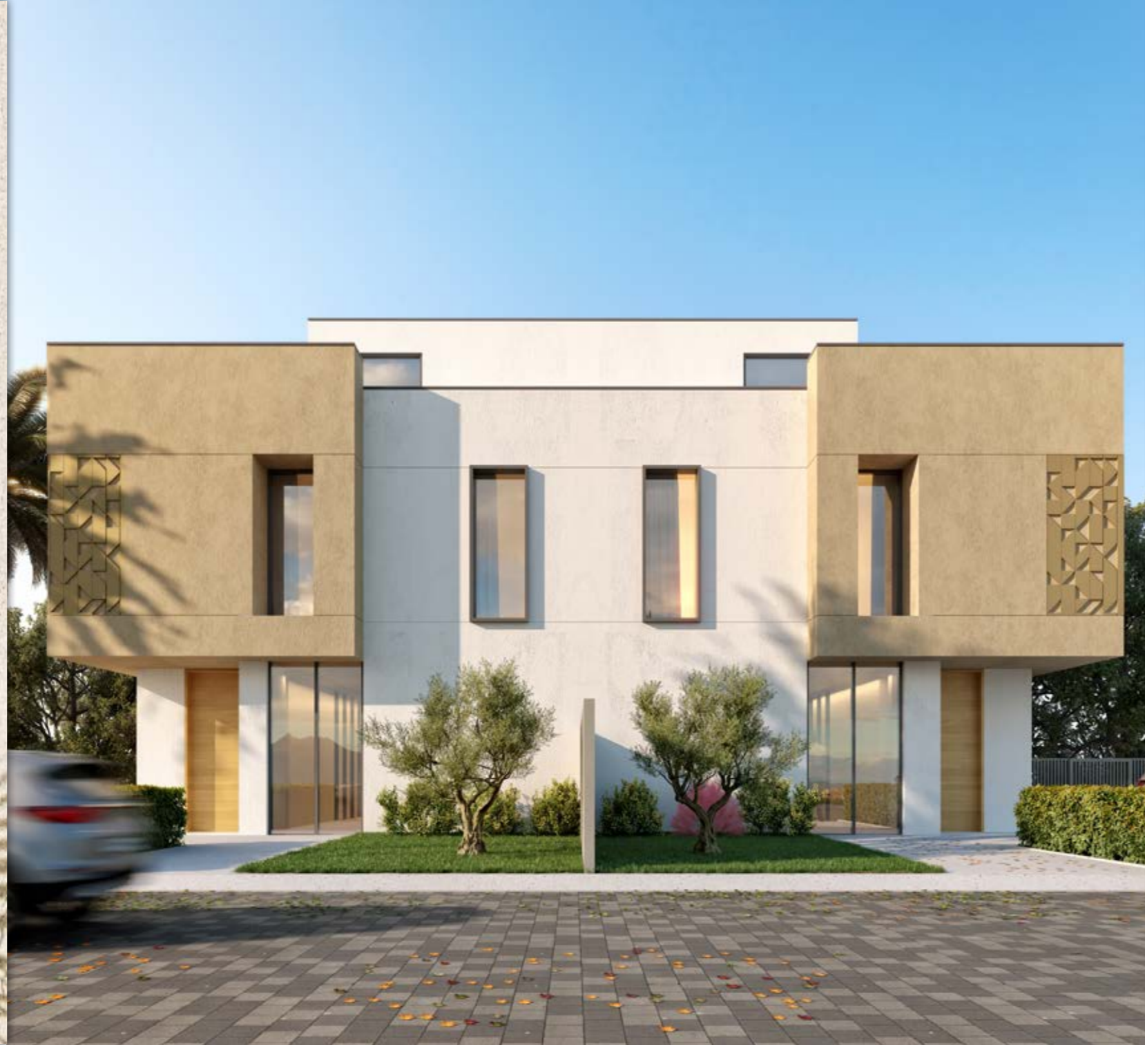
فيلا - ج - رمادي