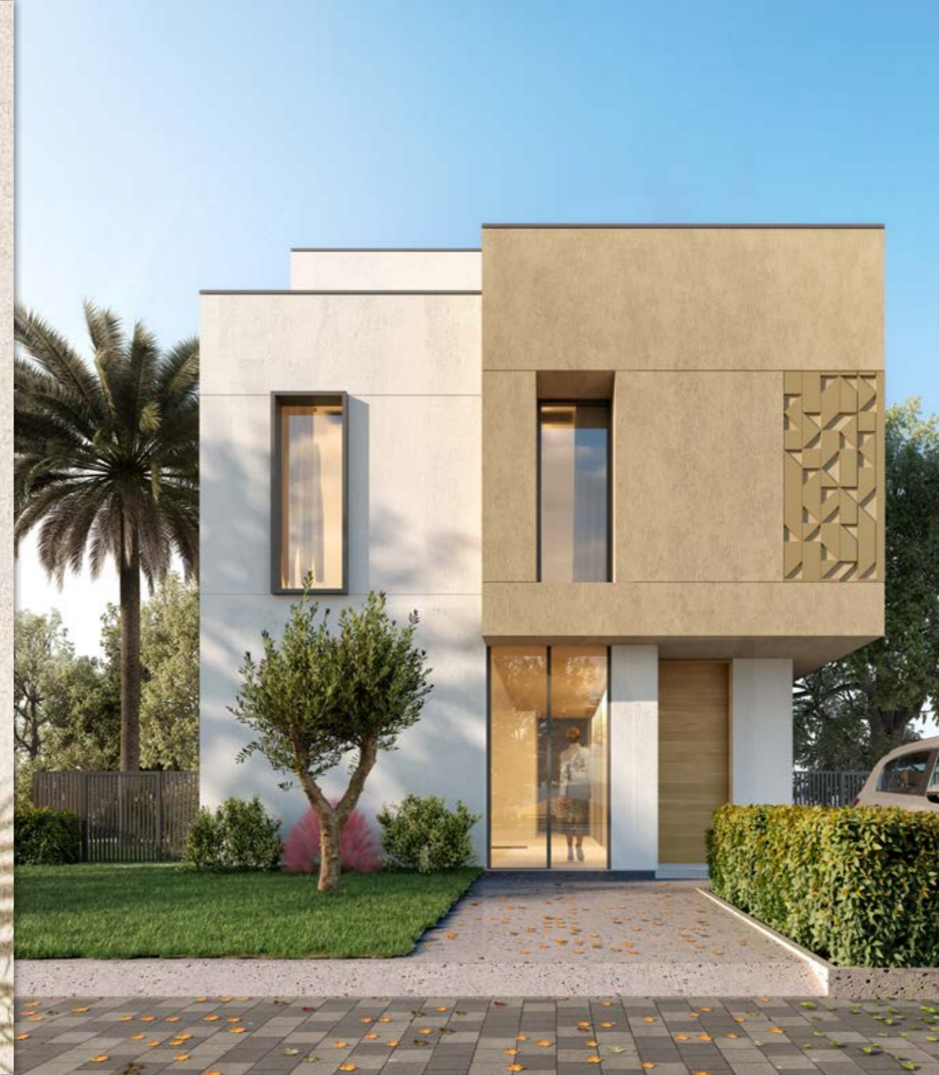
فيتلا B- لون بيتج