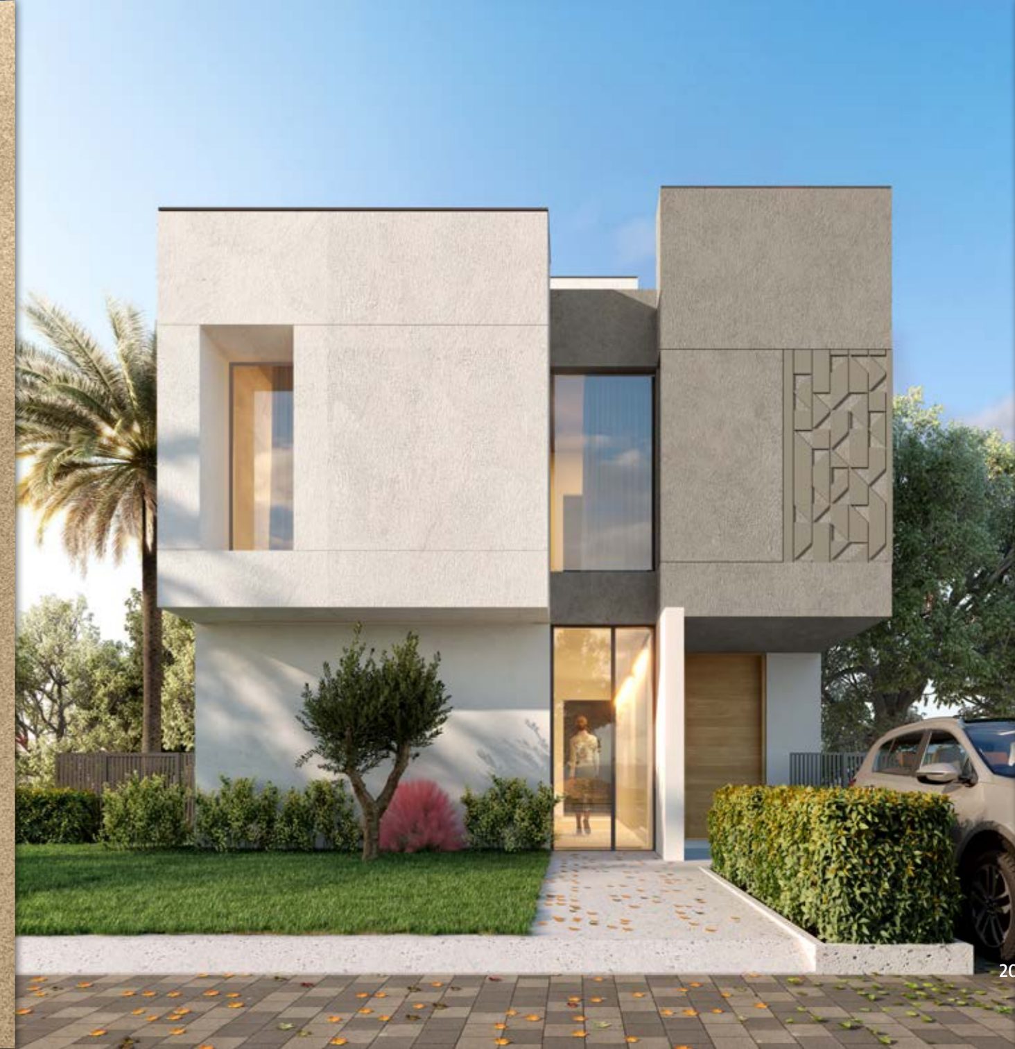
فيلا - A لون رمادي