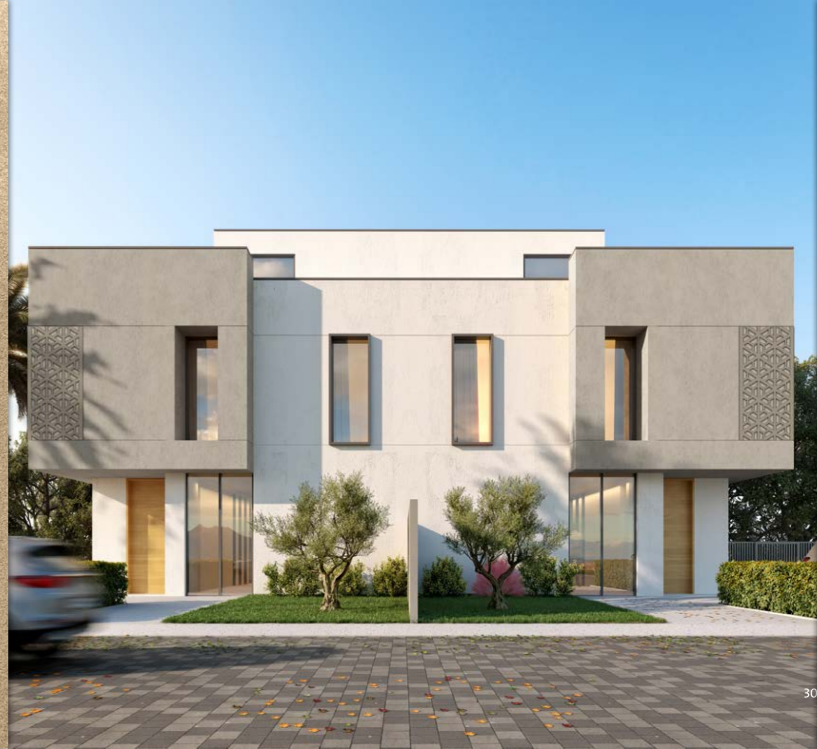
فيلا - ح - لون رمادي