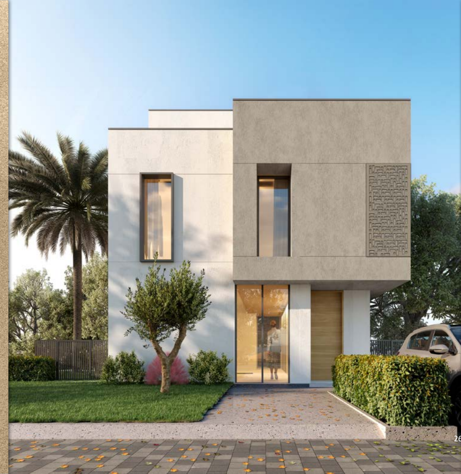
فيتلا B- لون رمادي