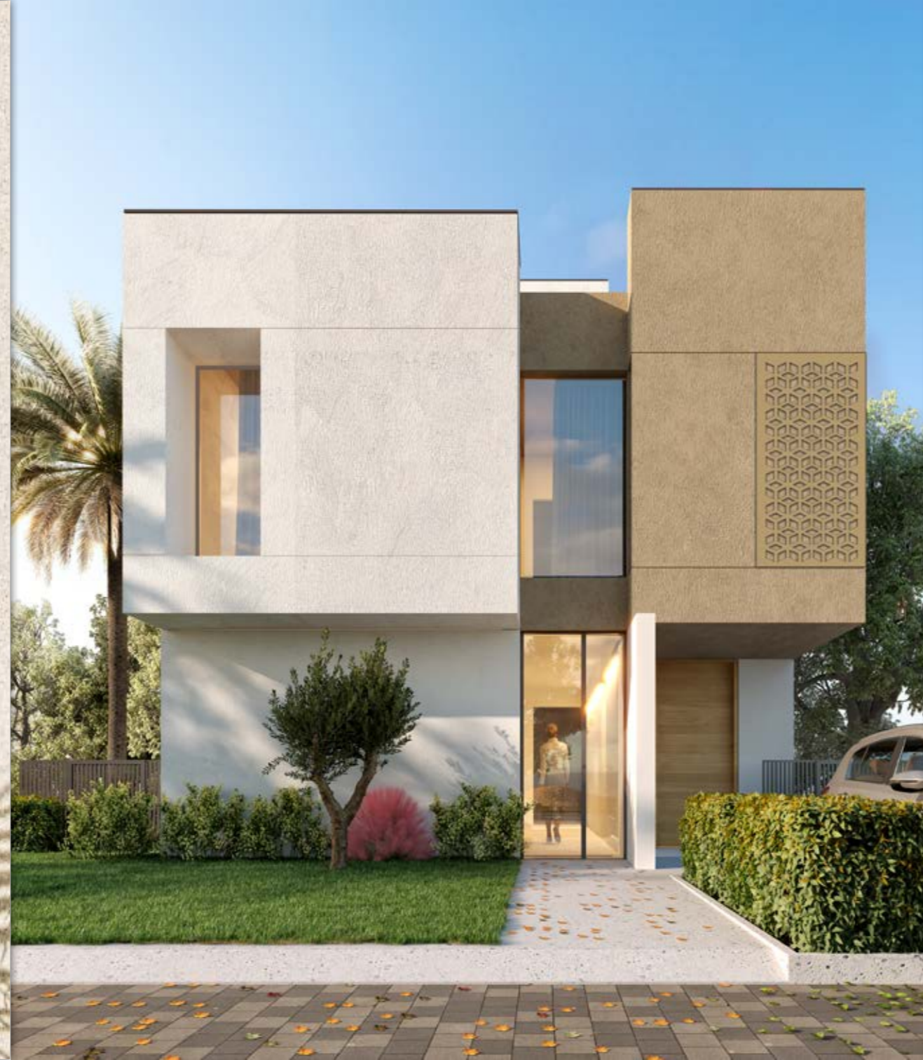
فيلا - A لون بيتج